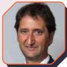
Angel Quemada [De 2019 a 2023] Decano | Ilustre Colegio de Procuradores de Barcelona Presidente | Consejo del Colegio de Procuradores de Tribunales de Cataluña